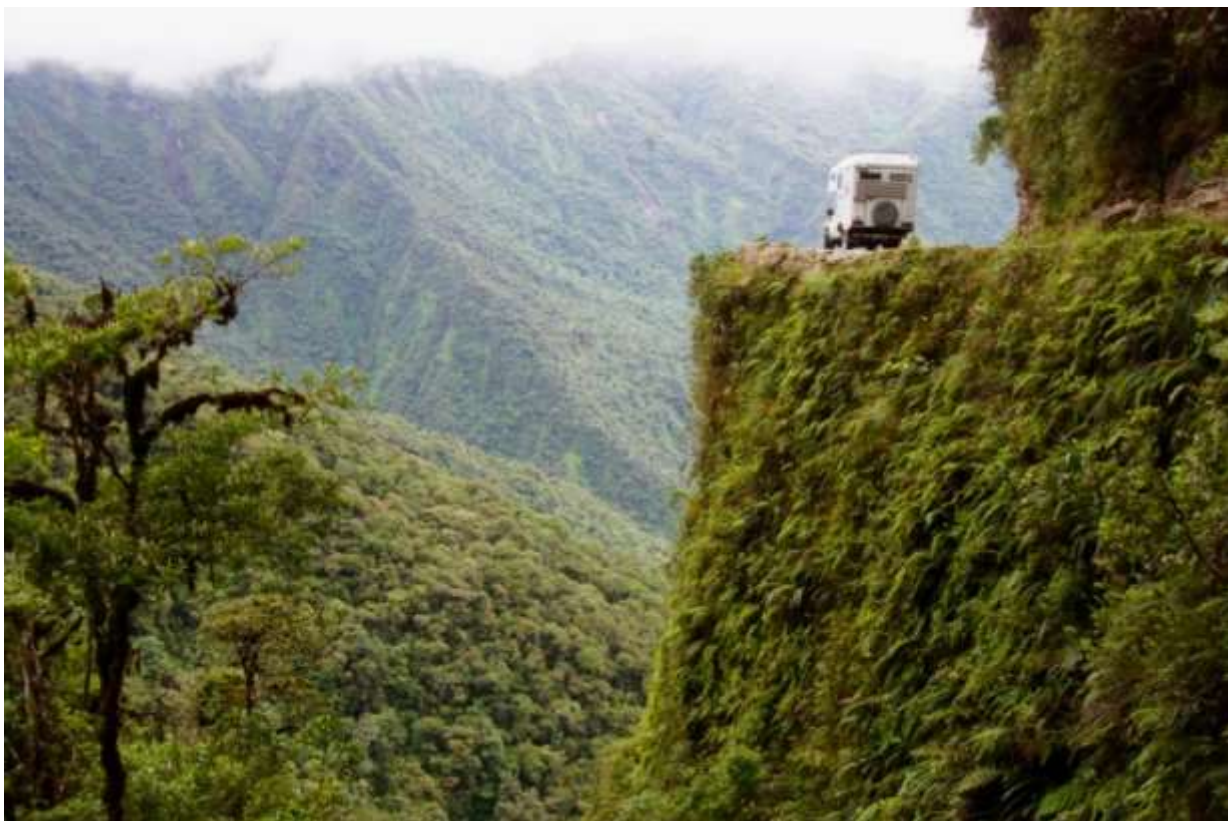
• Ruta de la muerte, Bolivia / Martin Spycher