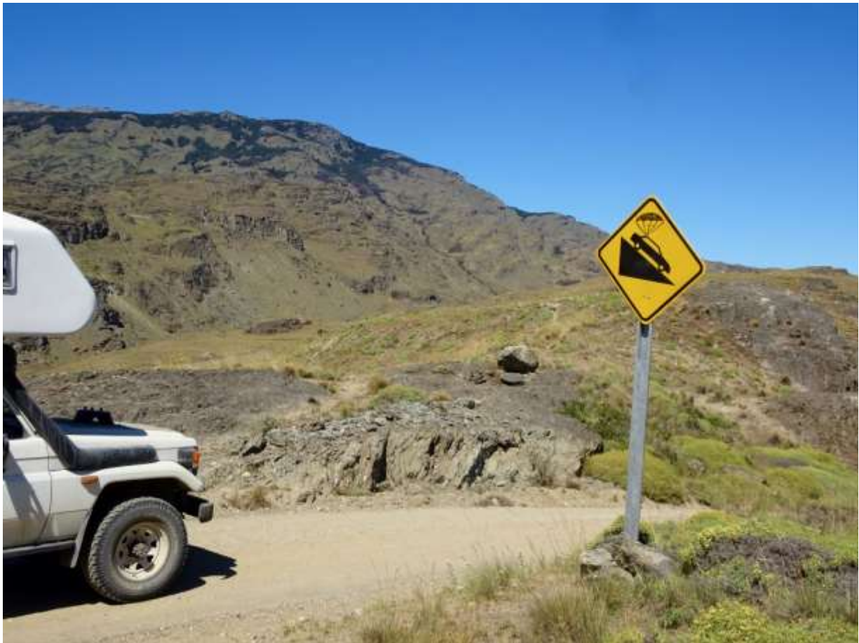
• Carretera Austral, Čile