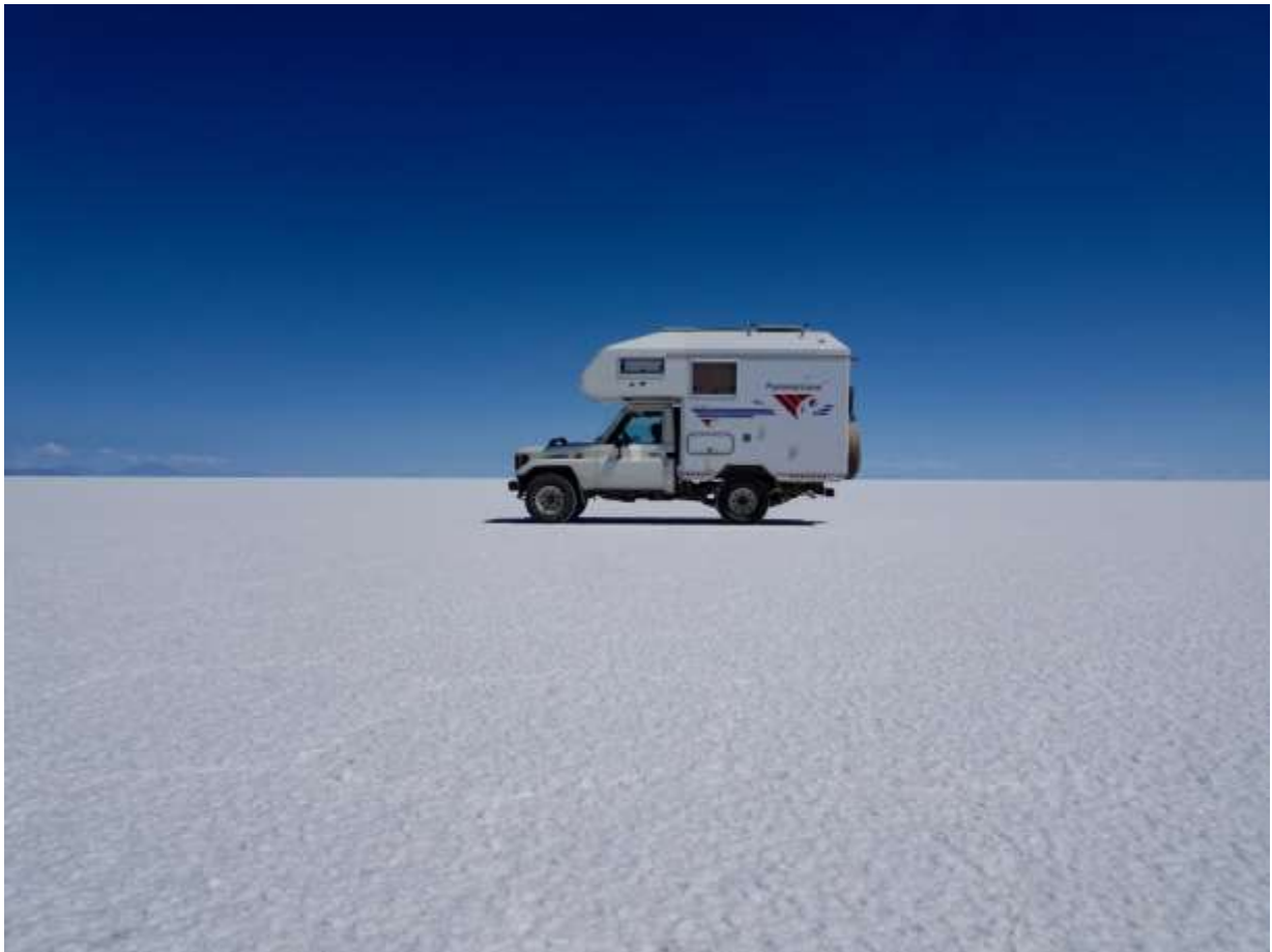
• Salar de Uyuni, Bolivia