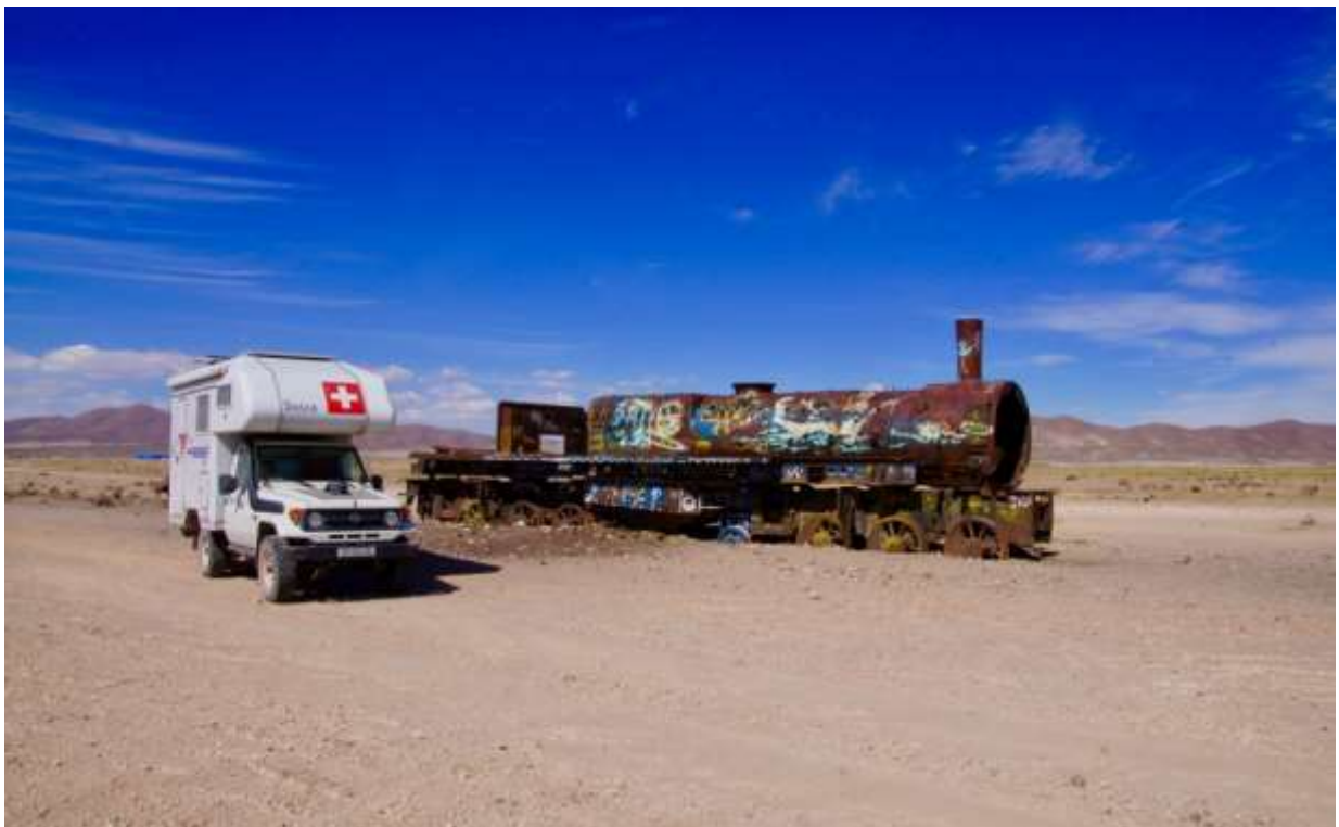
• Železniško pokopališče Uyuni, Bolivija / Martin Spycher