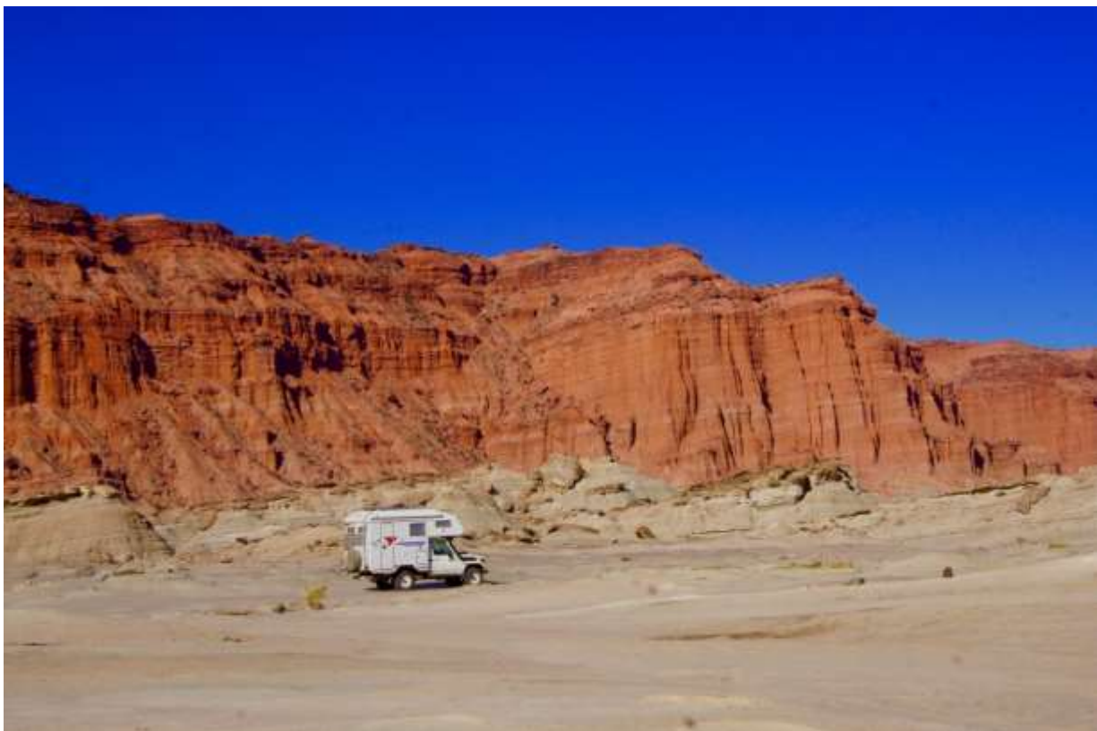
Ischigualastro, Argentina