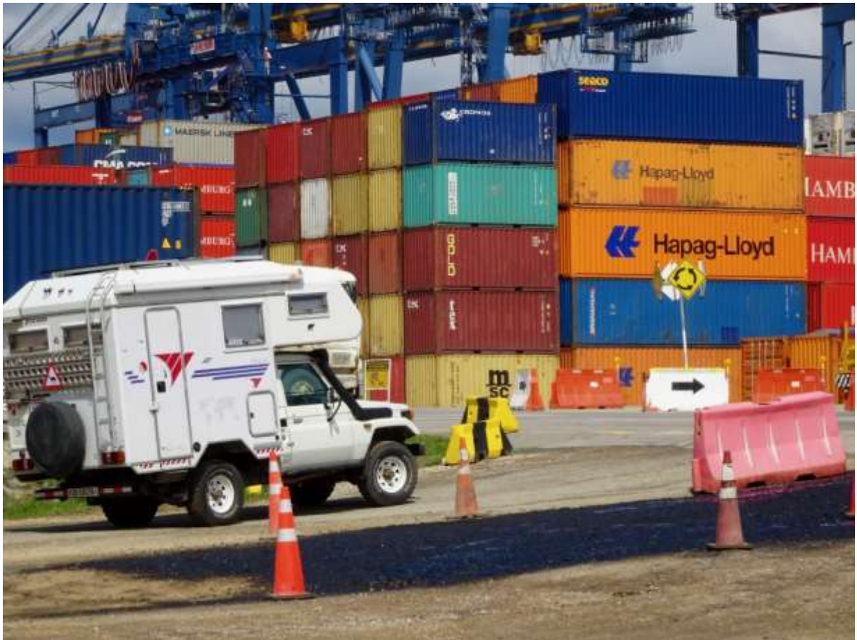
• Pristanišče Cartagena / Kolumbija / Martin Spycher