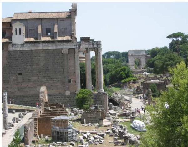
Ostanki starega dela