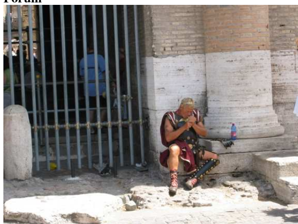
Izmučeni Rimski bojevnik

Pri koloseju je postaja B linije podzemne železnice (tu žigosamo karte) , peljemo se dve postaji do terminala (Termini), kjer prestopimo na linijo A , ki nas po šestih postankih pripelje do neposredne bližine Vatikana (postaja San Pietro). Mladina si zaželi Mcdonalds in tudi starina nima nič proti. Osredotočimo se na to znamenitost, vendar smo neuspešni, zato končamo v restavraciji, ki je v neposredni bližini Trga Svetega Petra.