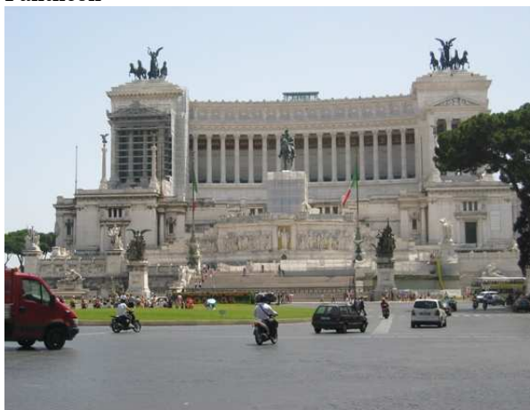
spomenik Vittorie Emanuelle