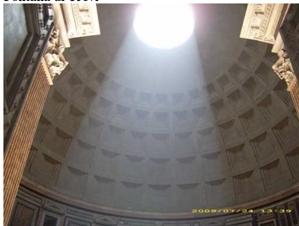
Pantheon - notranjost