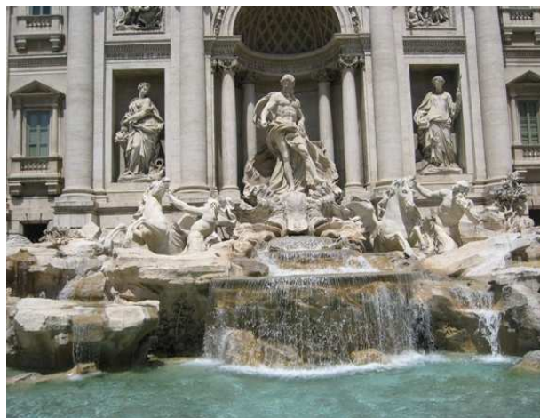
Fontana di Trevi