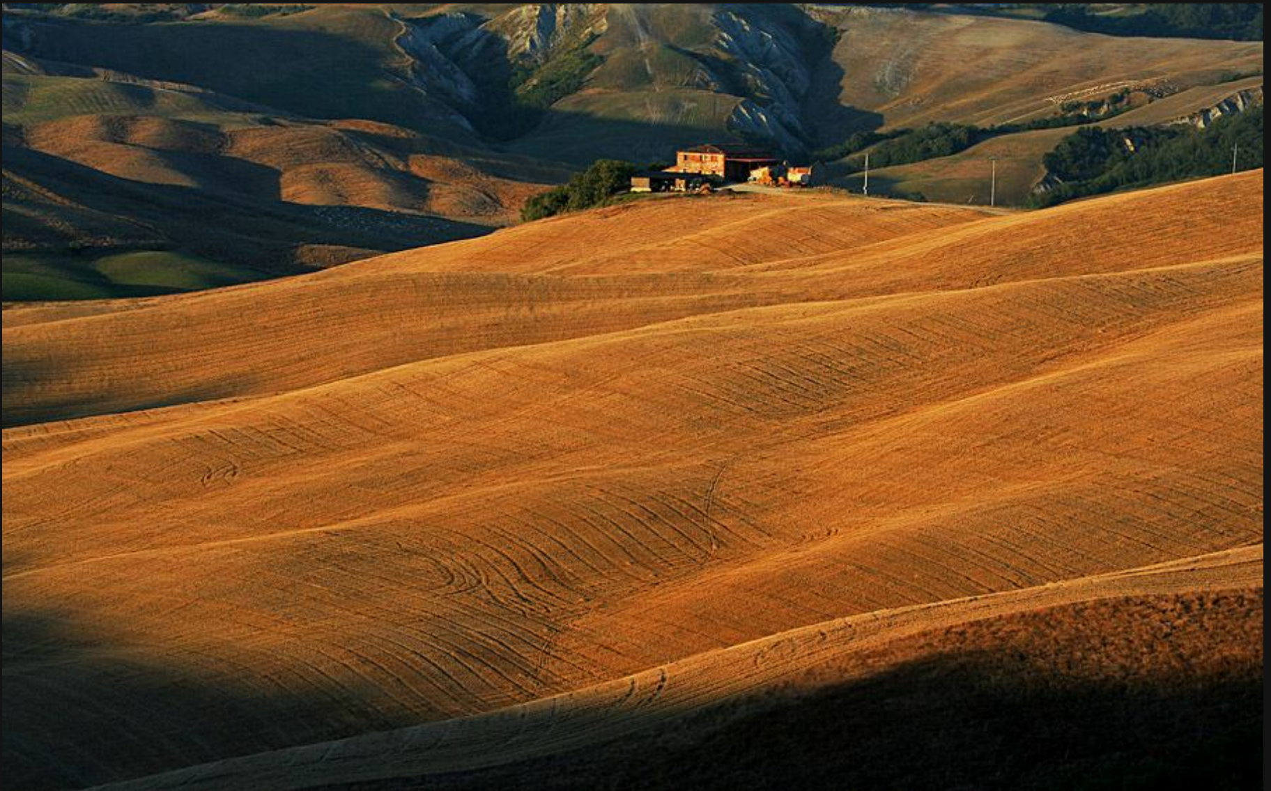
Toskanski griči I

Tu sva se potepala že med prvomajskimi prazniki, pokrajina pa je bila v tem času prav fantastično drugačna. Večerna svetloba je v že tako pravljичno pokrajino vtkala še nek mističen pridih in z »gasilsko cevjo« namesto slamice sva srkala nektar, ki bo kot kakšen antioksidant blagodejno vplival na memorijo »sivo« sivih celic na jesen življenja.