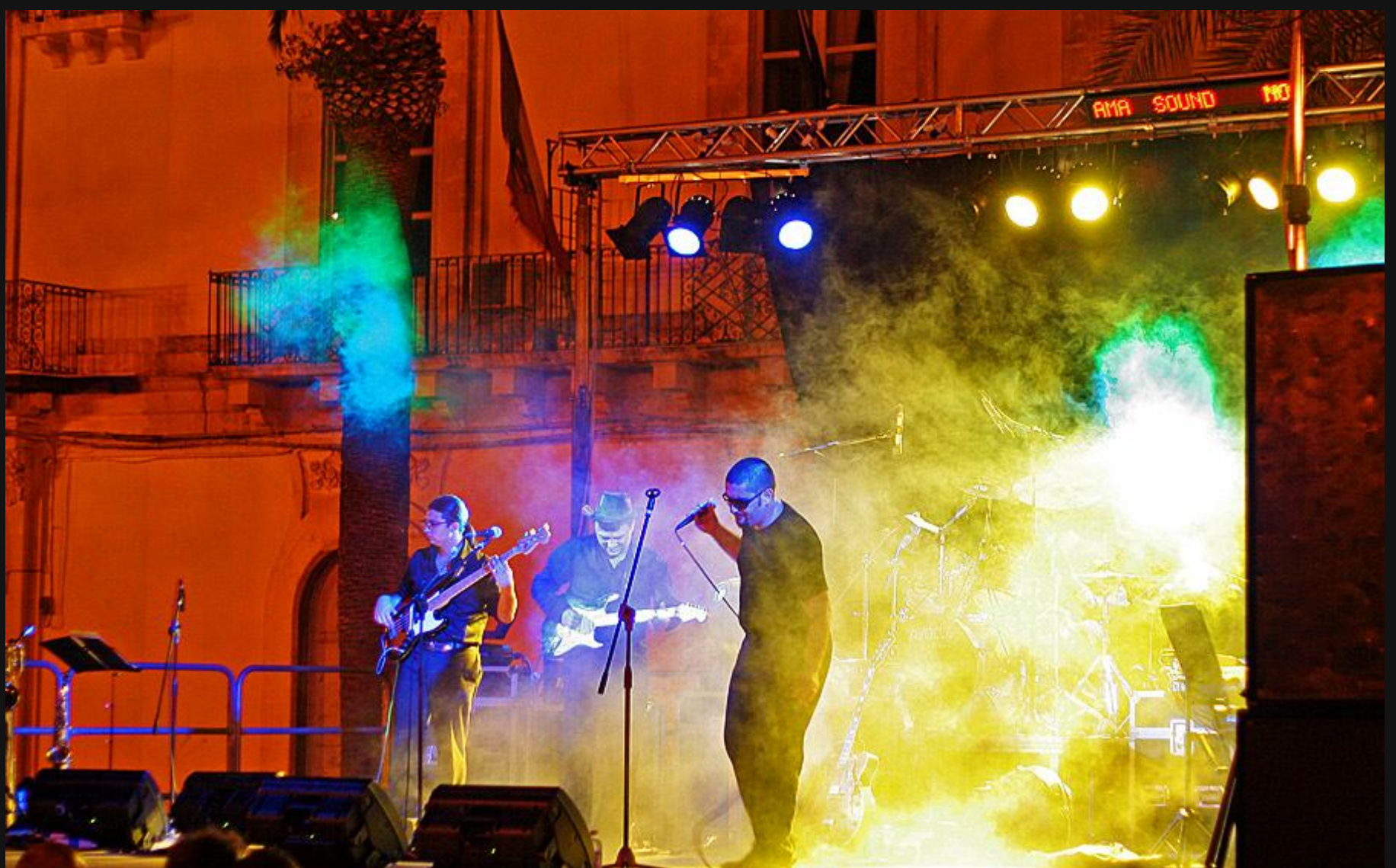
Zabava na višku

V kolikor bosta moja bralca kolovratila po Siciliji, obstaja kar nekaj lokacij, ki so » must see « in tudi midva jih nisva imela namena izpustiti. Seveda to včasih pomeni oddaljevanje od obale, a vendar bosta na koncu ugotovila, da se izplača.