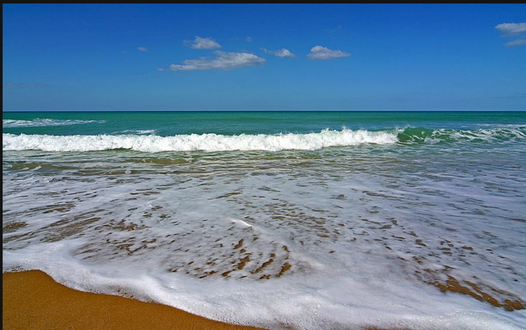
Obala pred Sciacco