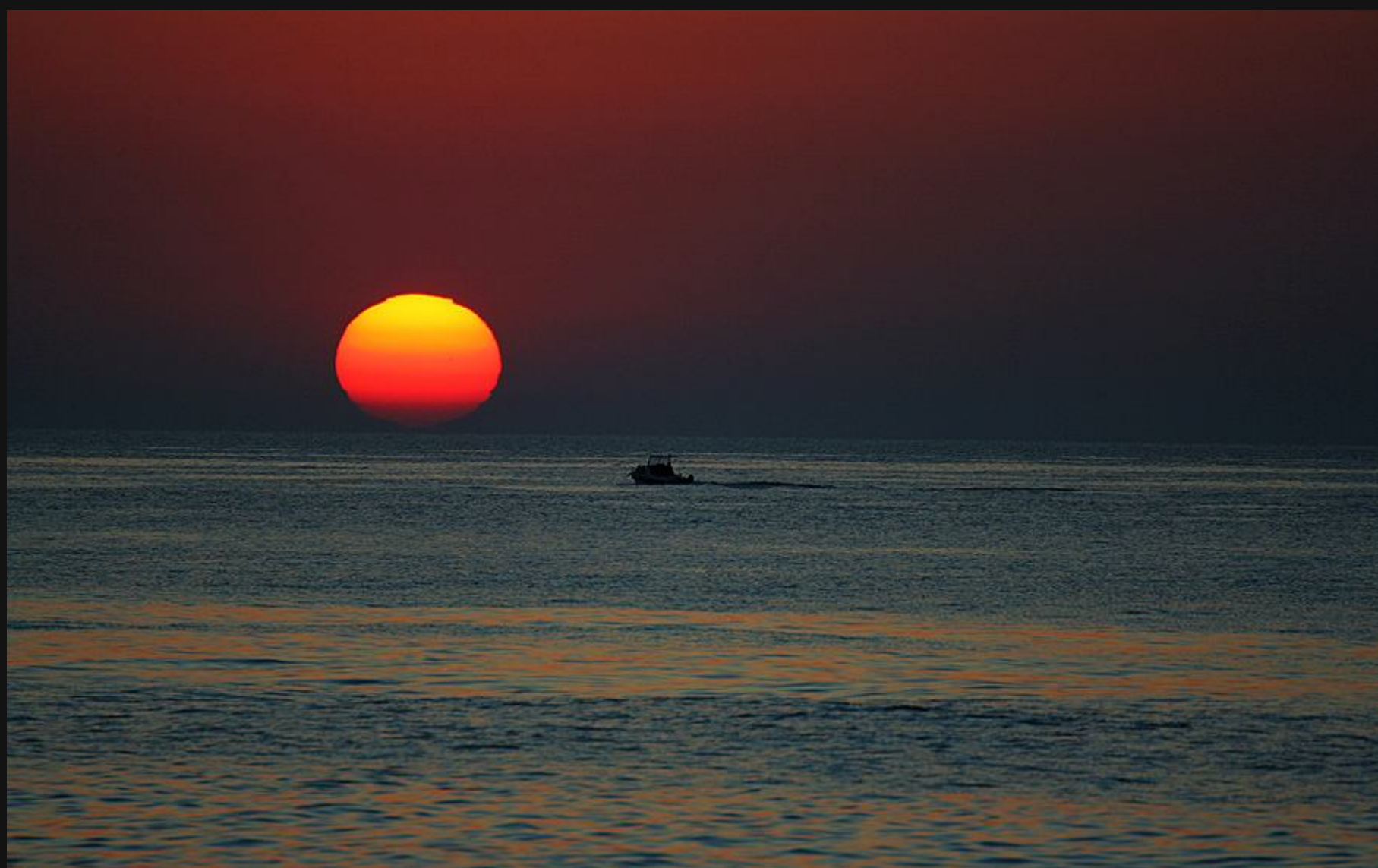
(05:44) Rana ura slovenskih fantov grob

Ideja, s katero sva se poigravala, je bila obisk Malte.