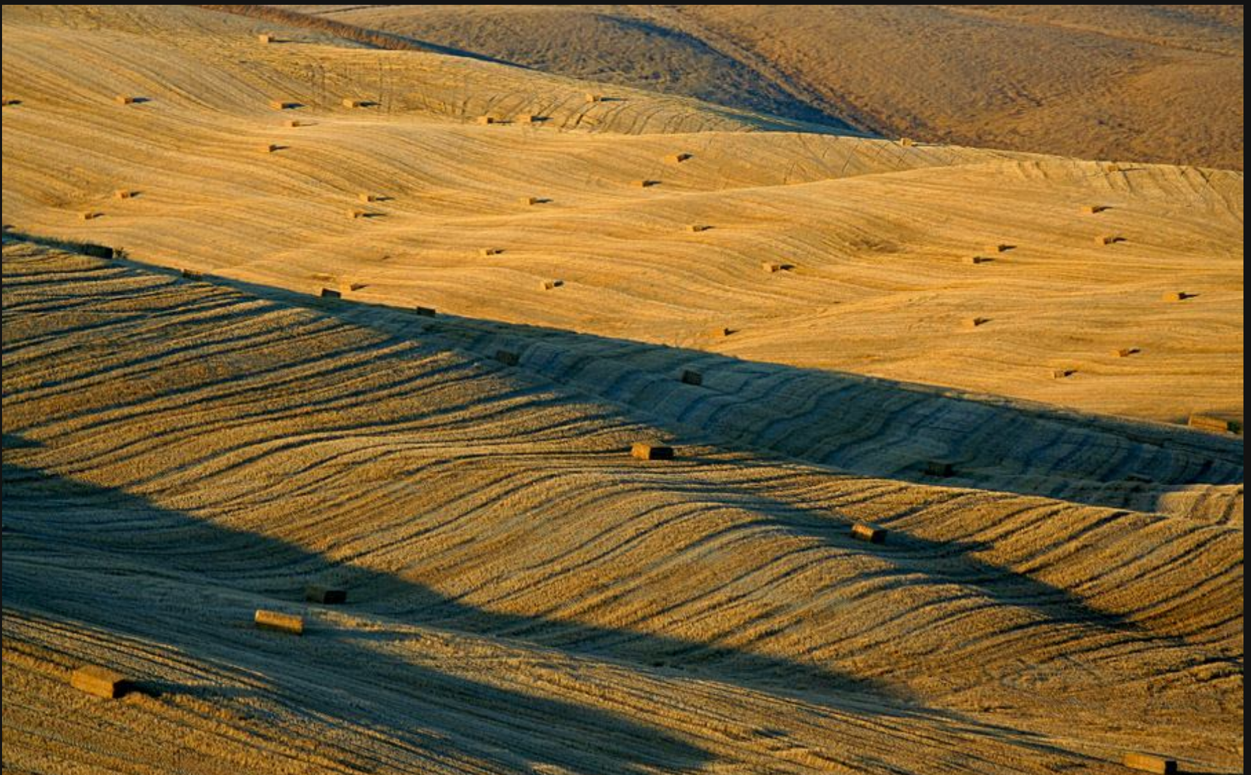
Toskanski griči II