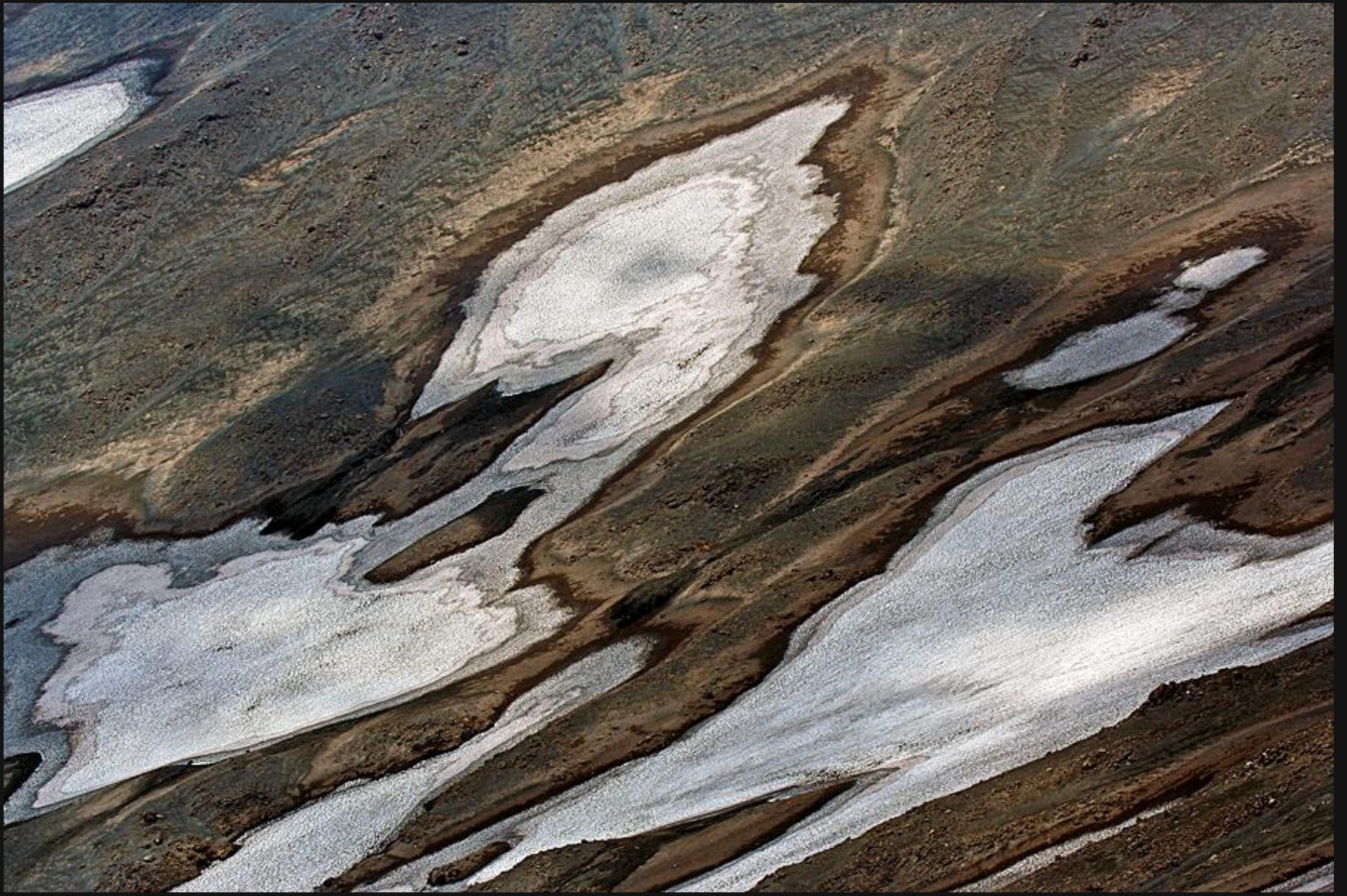
Abstrakt z »lune«

Etno sva osvojila na čisto turistični način. Terenski off road avtobusi, narejeni na osnovi Mercedes unimoga, vsak dan vozijo trume turistov na pobočja. Obisk bralcema toplo priporočam, sploh v kolikor še nista bila na luni, kajti občutek sem imel, da se bo zdaj, zdaj izza pobočja z lunarnim modulom pripeljal Neil Armstrong & co.