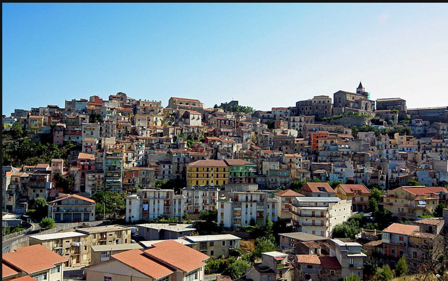
Castiglione di Sicilia

Parkirala sva v senci nad obzidjem z lepim razgledom na sosednjo vas Francavilla in se odpravila na potep. Pred gostilno je bilo polno kvartopircev kakor tudi obstranskih opazovalcev. Prisotna turista sva bila najbrž samo midva. Vrvež je bil sproščujoč, življenjski slog domorodcev pa meni pisan na kožo in posnemanja vreden.