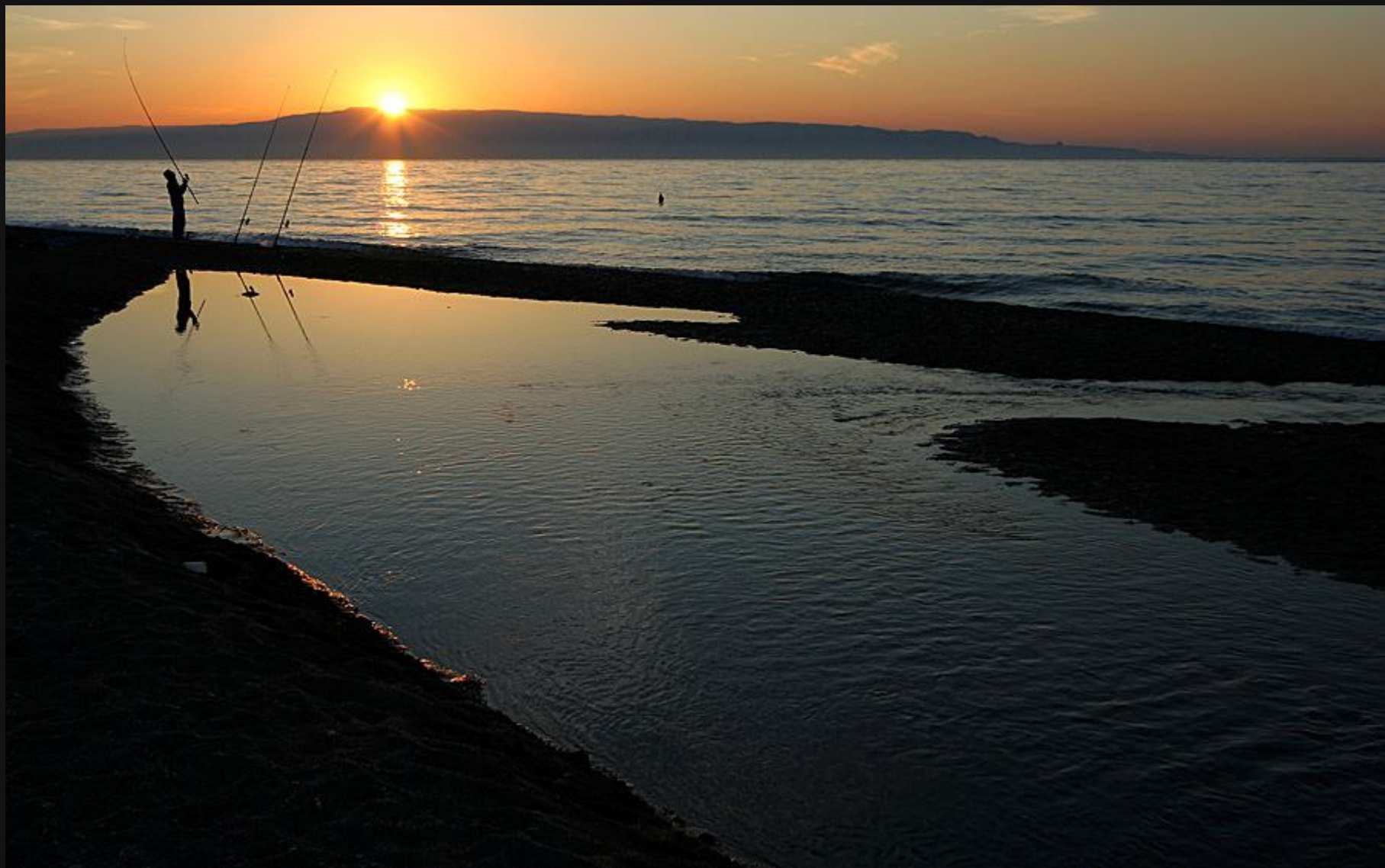
Santa Teresa di riva

Odrešitev pa se je le pokazala pri Santi Teresi di riva, kjer sva ob ustju skoraj presušene reke našla svoj prostor pod soncem.