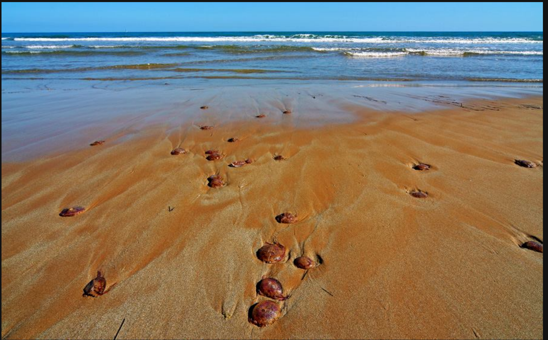
meduze pri Pozzallu